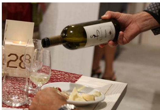
Degustazione vini con il Sommelier