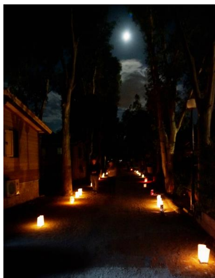
La notte magica delle lanterne

Cari Campeggiatori, Lunedì 5 Giugno 2017 riparte il nostro programma di attività orientato alla promozione delle tradizioni, cultura, gastronomia e natura della nostra bellissima Isola e del nostro territorio: